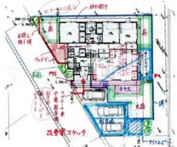
手描きの改善案の例→